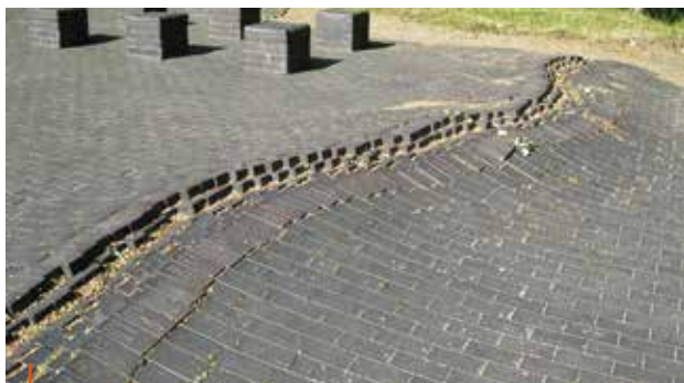
Monument 'Verscheurde aarde'

In 2015 is er een kleine groep uit Almen naar de 75-jarige herdenking van de bevrijding van het kamp geweest en hebben zij bloemen gelegd bij het massagraf waarin ook Gerrit Slagman ligt. Er waren bij deze herdenking nog 2 overlevenden aanwezig.