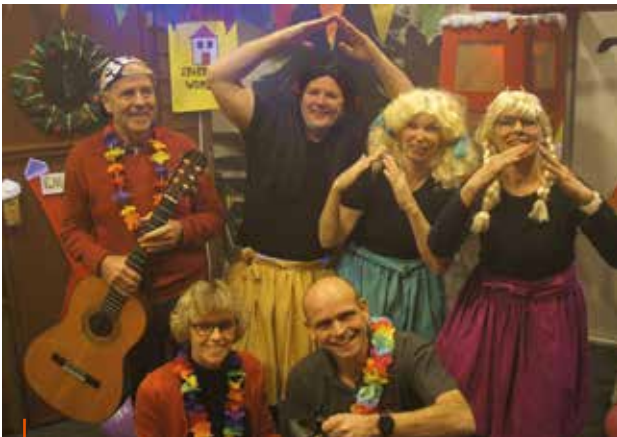
Het bestuur gaf een act met "Ons Huis" van K3

Er is en wordt volop gebruik gemaakt van het Dorpshuis. Aan het begin van dit jaar de playbackshow. Wat had de jeugd er weer een mooi decor neergezet. Wintersporttaferelen. Een heuse skihut, rijdende sneeuwschuiver, skiërs, vliegende traumahelikopter, bewegende skilift. Schitterend. Ook was er dit jaar geen gebrek aan deelnemers. Zelfs het bestuur zette zijn beste beentje voor.