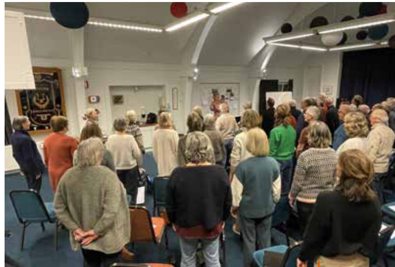
Veel extra zangers in de bovenzaal

Wil je de open sfeer en gezelligheid van ons koor ook zelf eens ervaren? Kom dan op dinsdagavond om 19.45 uur naar Ons Huis om vrijblijvend mee te zingen. We kunnen vooral bij de tenoren, bassen en (hoge) sopranen nog wat uitbreiding gebruiken, maar alten zijn natuurlijk ook van harte welkom. Je kunt drie keer kosteloos meedoen. Meld je vooraf even aan bij