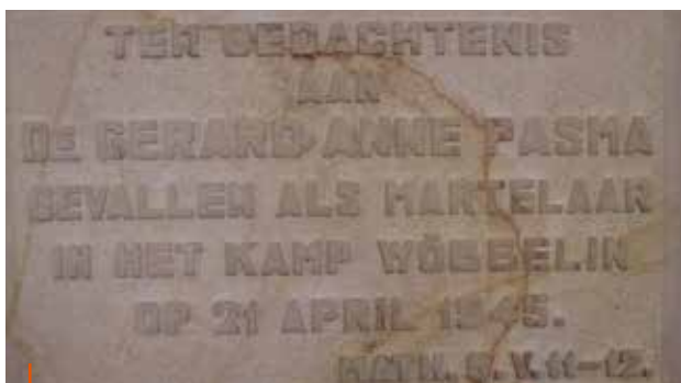
Gedenksteen kerk Almen