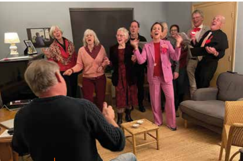
Een aubade aan huis

Het was voor ons een prachtige ervaring om zoveel mensen op deze manier te raken. Wie weet... misschien is hiermee wel een nieuwe traditie geboren!