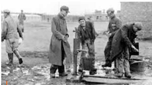
De enige waterpomp

Het Duitse rijk begint dan al te wankelen. De Russen rukken op uit het oosten, de chaos is groot en in allerijl moeten er voor de ontruimde kampen in het oosten nieuwe gebouwd worden, meer naar het westen. Pasma en te Brake hoorden bij de eerst groep van 500 die daaraan mee moesten bouwen. Nog voordat het nieuwe kamp gereed was kwamen er al andere transporten uit het oosten aan. Op het laatst waren er 5000 gevangenen die moesten leven in barakken zonder ramen en met slechts 1 waterpomp.